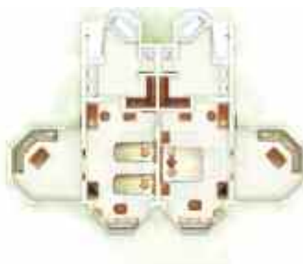
Suite Famille Family Suite