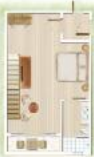
Loft Chambre principale Main bedroom